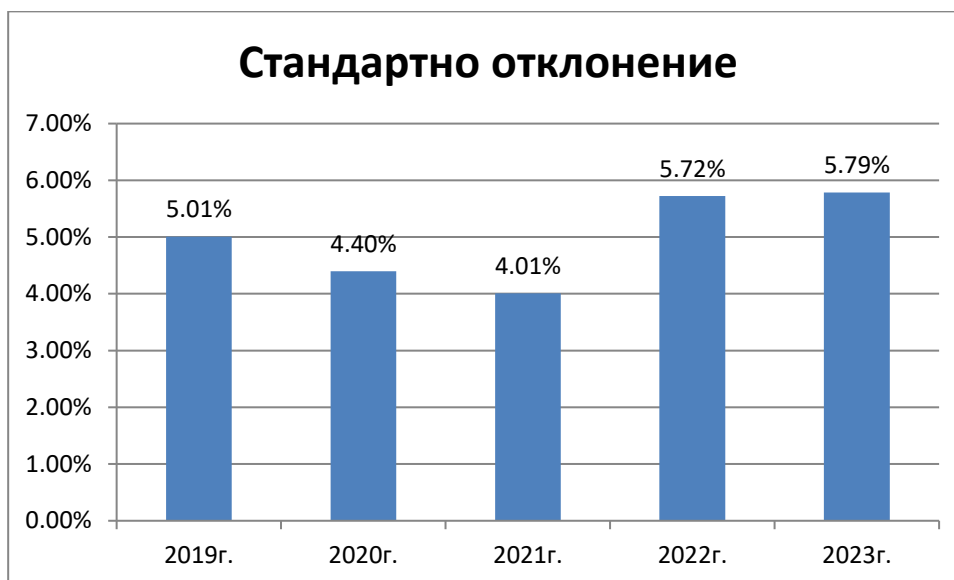
Стандартно отклонение на доходността за последните 5 години

Посочените резултати се отнасят за минал период и не следва да се считат като обещание за бъдещи резултати.