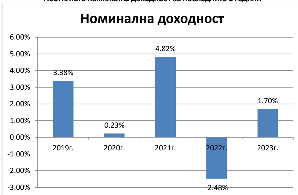
Постигната номинална доходност за последните 5 години

Посочените резултати се отнасят за минал период и не следва да се считат като обещание за бъдещи резултати.