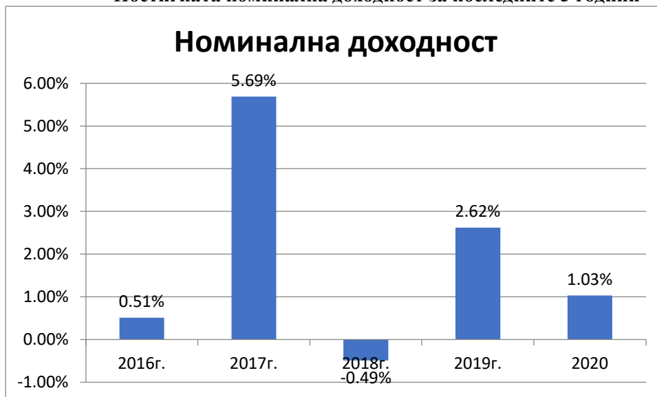
Постигната номинална доходност за последните 5 години

Посочените резултати се отнасят за минал период и не следва да се считат като обещание за бъдещи резултати.